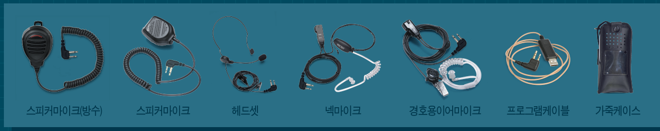
스피커마이크(방수) 스피커마이크 헤드셋 보ム마이크 경호용이어마이크 프로그램케이블 가죽케이스